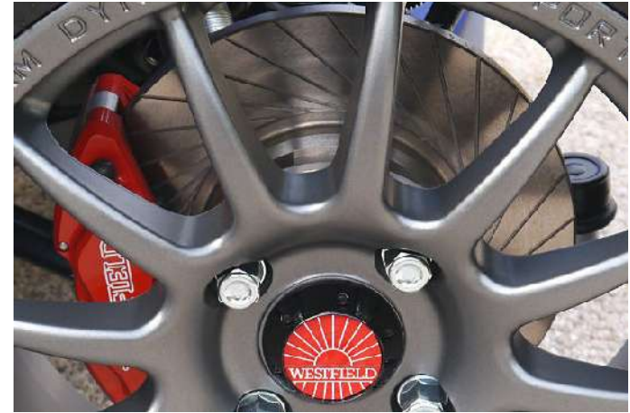
Disques rainurés et étriers de freins rouges