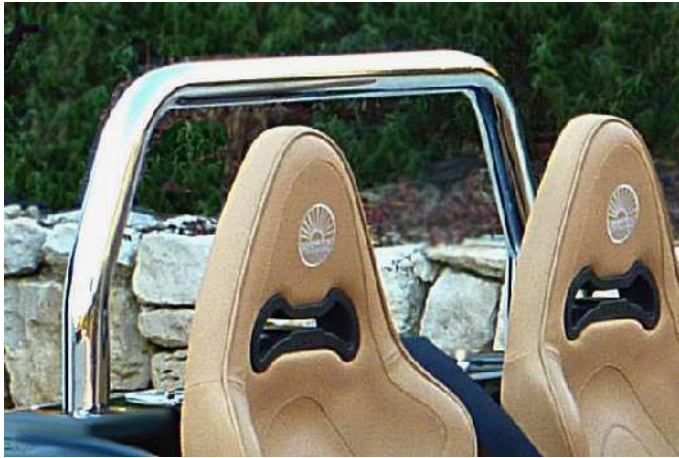
Arceau de sécurité chromé