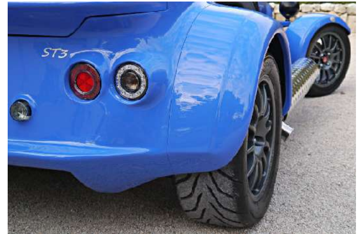
Pneumatiques Toyo 88 205 à l'avant et 215 à l'arrière