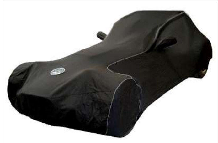
Housse d'intérieur noire avec logo Westfield