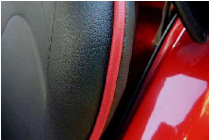
Sièges avec passepoil assorti