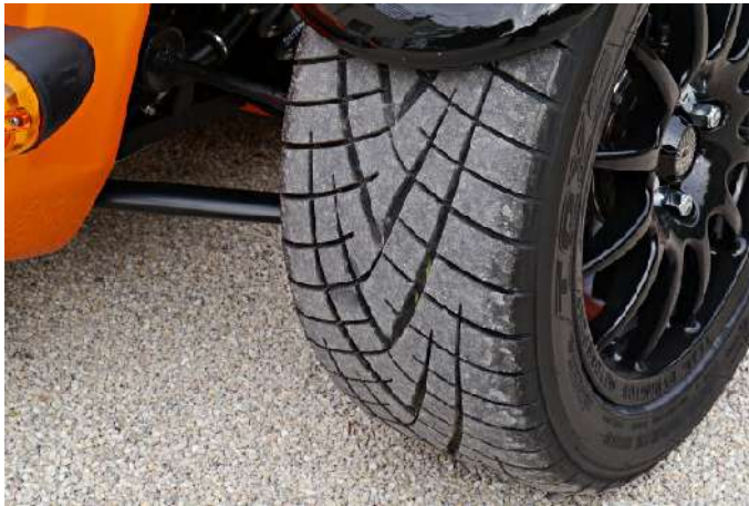
Pneumatiques Toyo 205 R1R