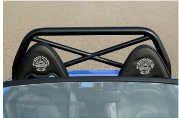
Arceau de sécurité "X welded" noir