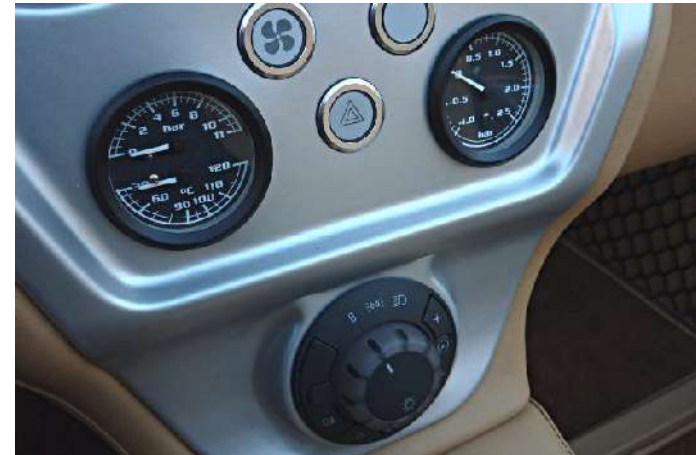
Jauges de température d'eau, de pression d'huile et de pression de turbo