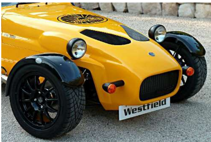
Carrosserie bicolore jaune avec ailes avant noires