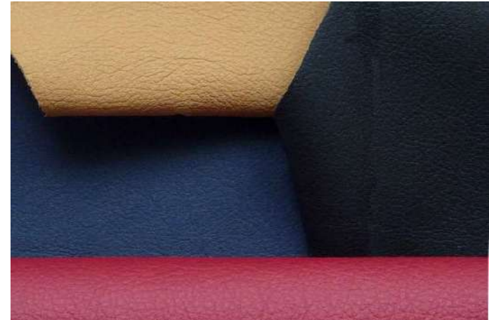
Sièges en cuir: Noir, biscuit, crimson, blue