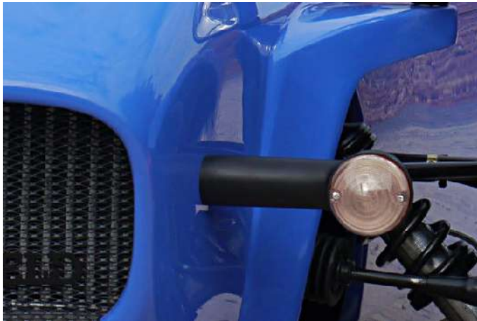
Clignotants avant "cristal"