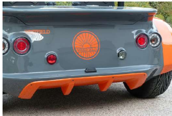
Diffuseur arrière en couleur