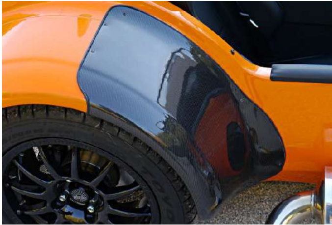
Protections d'ailes arrière en carbone