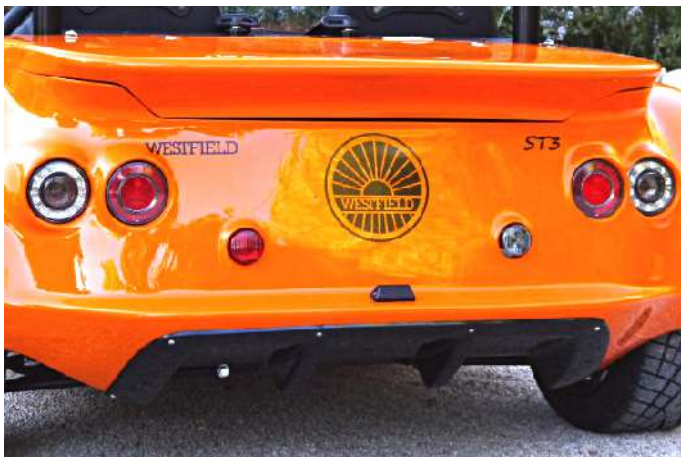
Diffuseur arrière noir